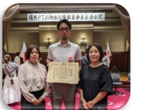
下作延小学校PTAの方々

【橘小学校PTA会長】このような素晴らしい賞を頂き、大変光栄に存じます。日頃よりご支援くださっている本部役員を始め保護者の皆さま、OB会の皆さま、そして地域の皆さまに、心より御礼申し上げます。今後も皆で力を合わせ、子どもたちの健やかな成長に少しでも貢献できましたら幸いです。