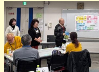
グループごとの発表の様子

令和7年12月19日(金)、高津市民館をいつもご利用いただいている皆様と一緒に、これからの高津市民館を考える『ファンミーティング』を開催しました。